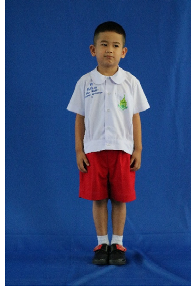
ตัวอย่างชุดพลະอนุบาล